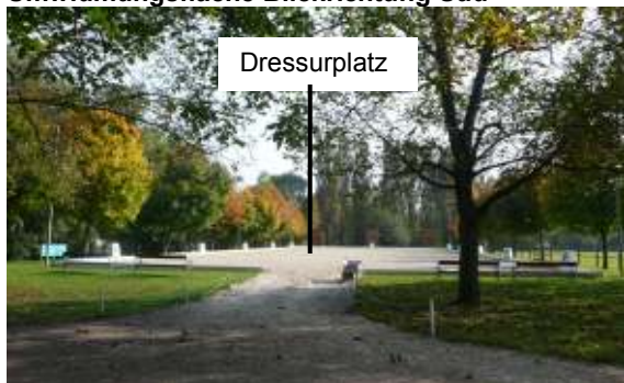
Umwidmungsfläche Blickrichtung Süd