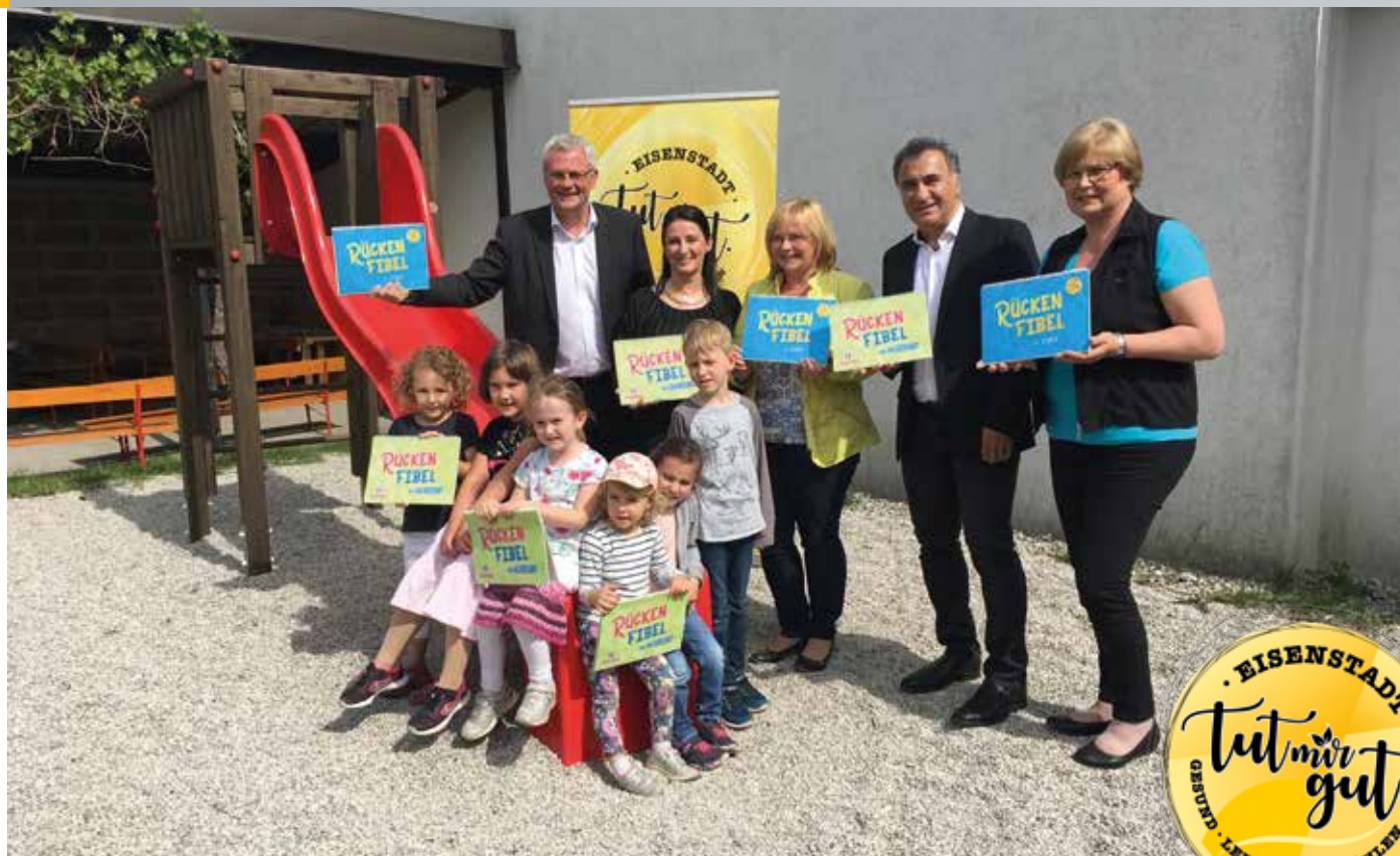
Mit der neuen Rückenfibel lernen Kinder auf spielerische Weise Übungen für einen gesunden, fitten Bewegungsapparat.