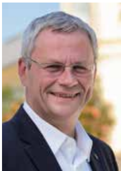
Bürgermeister Thomas Steiner