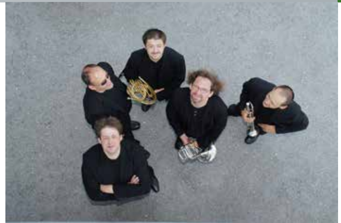
Die Musiker von Haydnbrass bespielen erneut den Pulverturm.