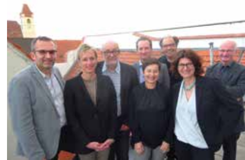
Vertreter des Vorstands des Vereins Freunde des Eisenstädter Schlossparks