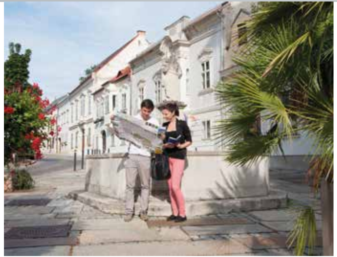
Die Landeshauptstadt ist bei Touristen sehr beliebt und legte in puncto Nächtigungsplus einen Traumstart im Jahr 2017 hin.

> März: + 27,5 %, Jänner bis März: + 15,2 %