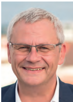
Bürgermeister Thomas Steiner