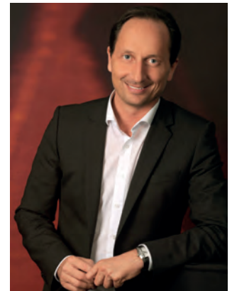
2. Vizebürgermeister LAbg. GÜNTER KOVACS SPÖ

In unserer neuen Serie wollen wir Ihnen in den kommenden Monaten die Arbeit des Gemeinderats und des Stadtsenats sowie die Aufgaben der einzelnen Ausschüsse näher bringen. In dieser Ausgabe starten wir mit den beiden Vizebürgermeistern.