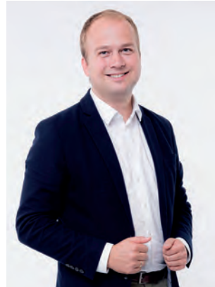
1. Vizebürgermeister ISTVAN DELI, BA ÖVP