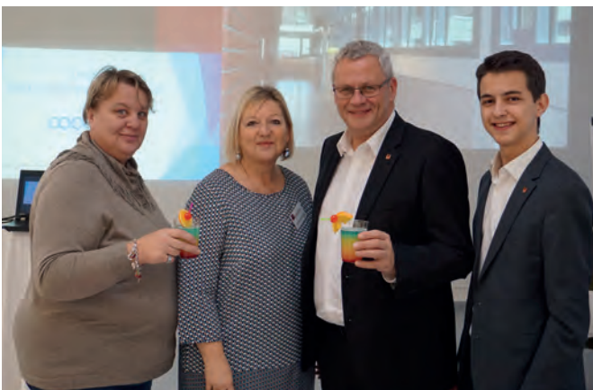
> Beim Tag der offenen Tür der HAK/HAS konnten sich interessierte Eltern ebenso wie potentielle Schüler einen Überblick über das Angebot der Schule machen.