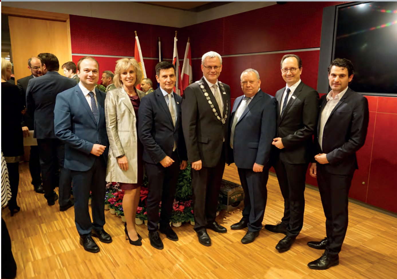
Bürgermeister Thomas Steiner mit 1. Vizebürgermeister Istvan Deli, NR Gaby Schwarz, Landtagspräsident Christian Illedits, 2. Landtagspräsident Rudolf Strommer, 2. Vizebürgermeister Günter Kovacs und NR Christoph Zarits