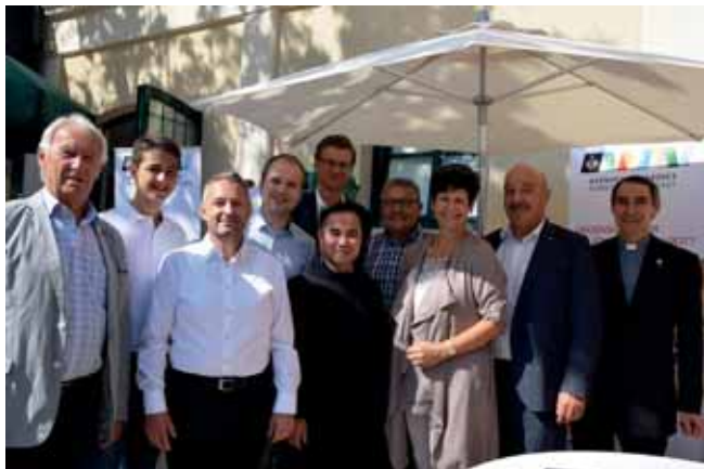
> Heuer fand bereits der 10. Antoni Heurige im Spitzer Haus des Krankenhauses der Barmherzigen Brüder statt. Das Fest wird immer anlässlich des Namensfestes des Patrons der Konventkirche, des Hl. Antonius von Padua, ausgerichtet. Der Reinerlös geht meist an Familien in Not.