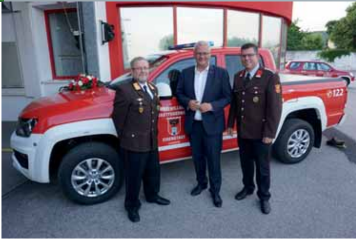
Fahrzeugsegnung in Eisenstadt