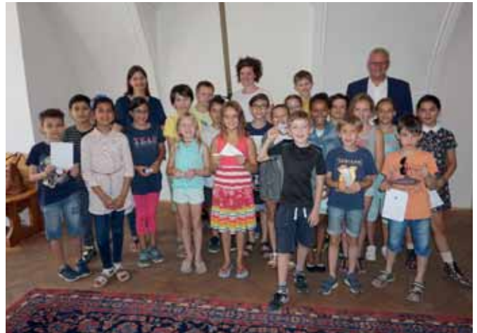
> Die 3d der Volksschule Eisenstadt besuchte kurz vor den Sommerferien das Rathaus und wurde von Bürgermeister Thomas Steiner in seinem Büro begrüßt. Er stellte sich ausführlich den Fragen der Kinder und lud sie anschließend zur Jause ein.