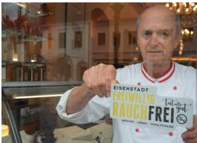
CAFÉ – KONDITOREI ARNBERGER

Schon lange vor der Aktion „Freiwillig Rauchfrei in Eisenstadt“ verbannte Familie Arnberger den blauen Dunst aus ihrer Konditorei. Kein Wunder – schmecken doch Punschkrapferl und Haydntorte viel besser ohne Zigarettenqualm vom Nebentisch! Die Café-Konditorei ARNBERGER am Hauptplatz in Eisenstadt bietet neben hausgemachten Mehlspeisen und Tortenspezialitäten für jeden Anlass, auch verschiedenste Kaffee- und Teevariationen in gemütlicher Atmosphäre und feinem Ambiente an.