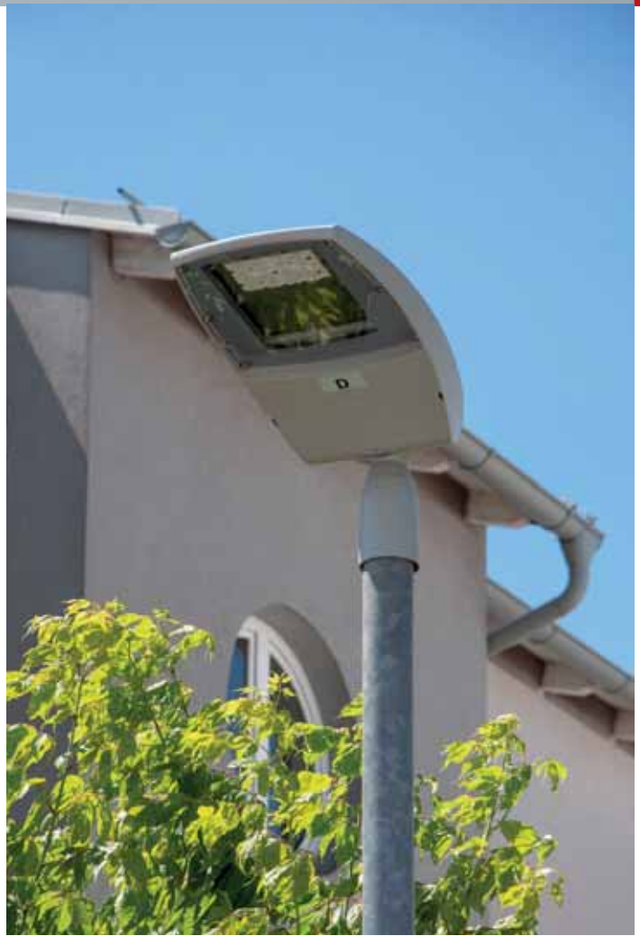
Etliche Laternen sind bereits auf LED umgerüstet worden.

Die burgenländische Landeshauptstadt stellt die gesamte öffentliche Beleuchtung auf LED um. Dadurch spart die Stadt nicht nur Stromkosten, sondern auch Instandhaltungskosten, da die neuen LED-Leuchtkörper deutlich langlebiger sind. Mit der Umstellung wurde bereits Anfang Juni begonnen und nimmt rund sechs Monate in Anspruch.