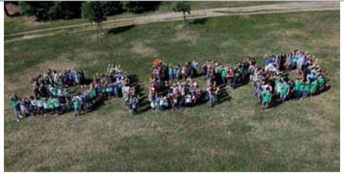
Mehr als 200 Schüler unterschiedlichster Altersklassen nahmen begeistert am Projekt SAGMO – SCHULE MACHT GREEN-MOBIL! teil.