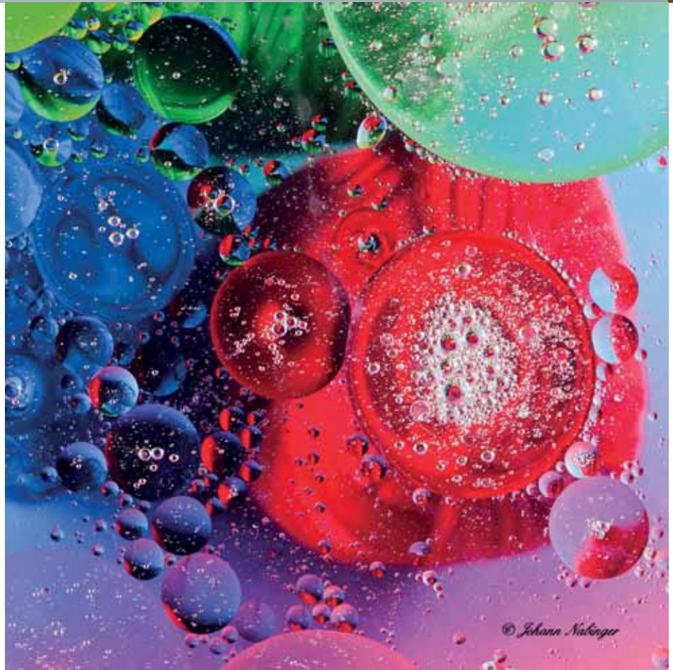
Beeindruckende Fotografien im Pulverturm

Unter dem Thema „ABSTRAKT“ veranstaltet der Fotostammtisch „Offene Blende“ bereits seine dritte Freilicht-Fotoausstellung im Pulverturm.