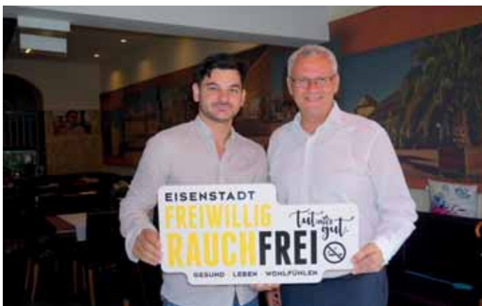
STADTRESTAURANT ELLA ITALIA

Il Bagnino – Allsportzentrum, Bad Kissingen-Platz 1