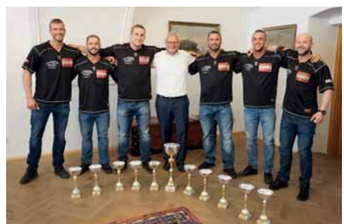
> Eisenstadt kann derzeit als Nabel der österreichischen Bodybuilding-Welt bezeichnet werden. Bei den kürzlich im Kulturzentrum Eisenstadt abgehaltenen 37. NABBA / 19. WFF Austrian Championships 2018 dominierten die Athleten des Fitnessparks alle Klassen! Glückwunsch an die starken Männer.