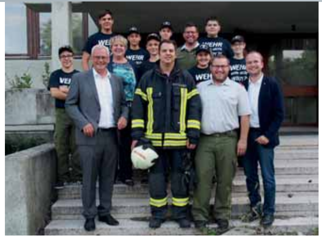
Inspizierung bei der Feuerwehr in St. Georgen

> Bezirksfeuerwehrkommando Freistadt Eisenstadt