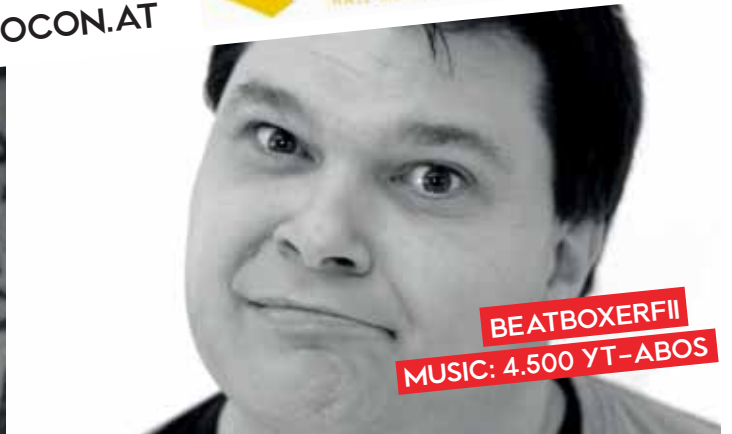
BEATBOXERFII MUSIC: 4.500 YT-ABOS