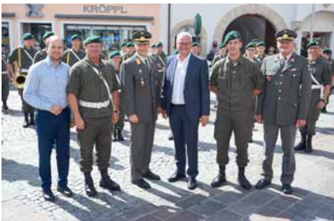
> 2018 wird die Martin-Kaserne 160 Jahre alt. Am 7. Juli wurde dieser Geburtstag mit einem Tag der offenen Tür in der Kaserne und einem Platzkonzert in der Fußgängerzone gefeiert.