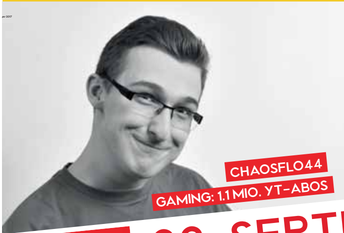
CHAOSFLO44 GAMING: 1.1 MIO. YT-ABOS