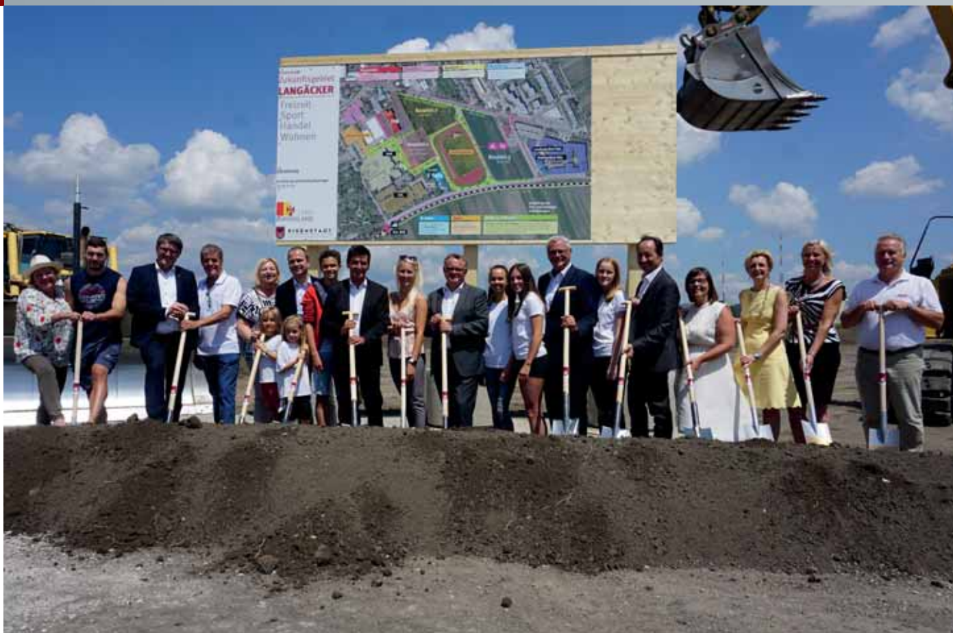
Im Juli erfolgte der Spatenstich für die Leichtathletikanlage, die neben dem E_Cube gebaut wird.