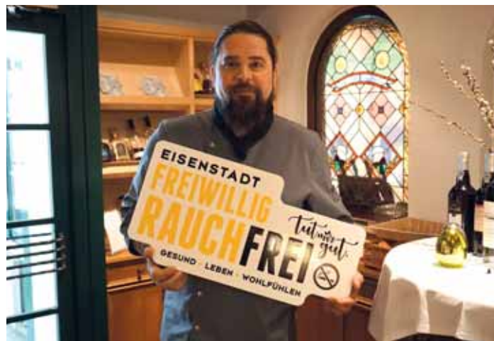
HOTEL RESTAURANT OHR