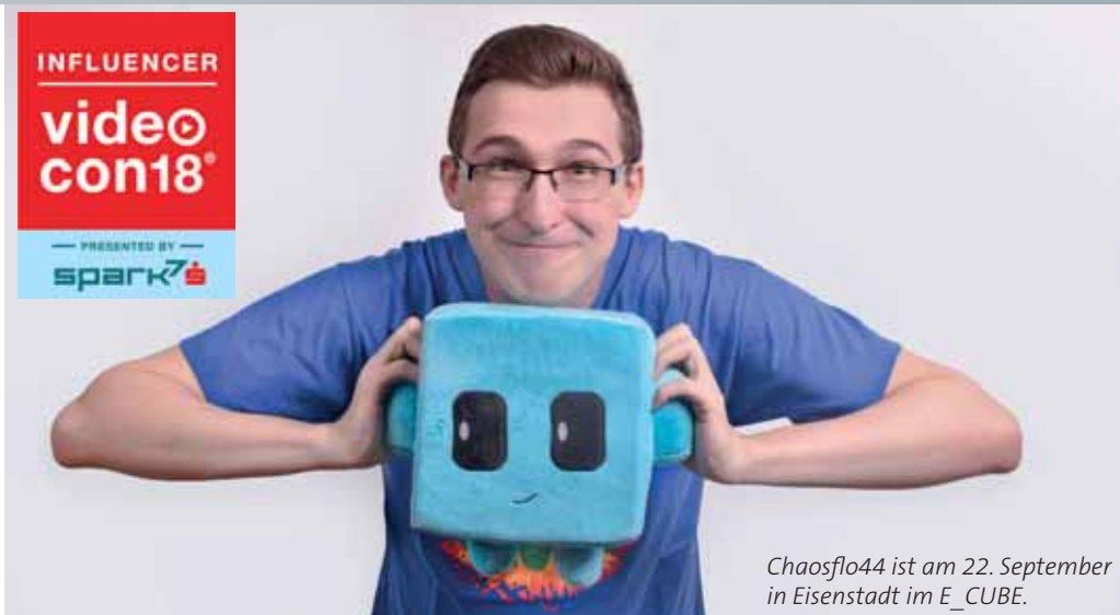
Chaosflo44 ist am 22. September in Eisenstadt im E_CUBE.