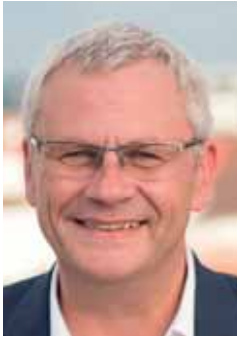
Bürgermeister Thomas Steiner